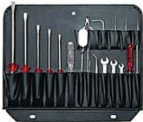
CB1 Frente: 20 bolsas Trazeira: Porta-papeis