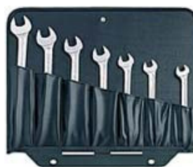
MB3 Frente: 12 bolsas Trazeira: 7 bolsas