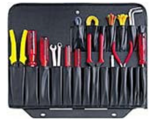
MB4 Frente: 21 bolsas Trazeira: Porta-papeis