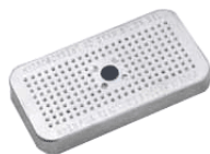
PeliSil, sílica gel