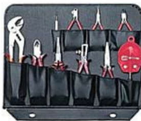
CB2 Frente: 10 bolsas Trazeira: 8 bolsas