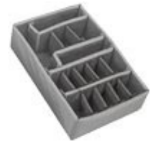
Kit de divisórias Peli